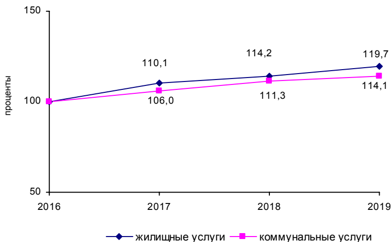
Индексы тарифов на жилищные и коммунальные услуги (в % к декабрю 2016 года)

В целом за 2019 год населению оказано жилищных услуг на 51,6 млрд. рублей, коммунальных услуг – на 87,3 млрд. рублей. Коммунальные платежи составили 63% расходов населения на оплату жилищно-коммунальных услуг.